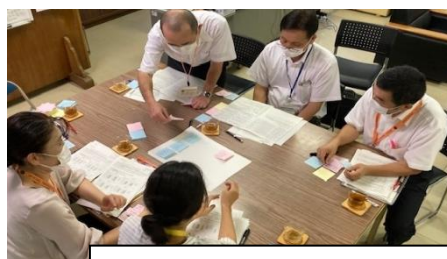
グループで意見を出し合いました