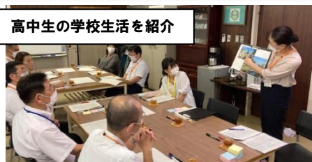
高中生の学校生活を紹介

9月22日（金）午後から、本校の校長室を会場に、第3回学校運営協議会が行われました。学校運営協議会は、仙台市の「地域とともに歩む学校づくり」の一層の推進を目的として設置されている組織で、保護者の方々や地域住民の皆様が学校づくりに参画していただくことで、「地域総ぐるみでの教育」を進めるものです。この日は、学校から上半期の学校生活についてお伝えした後、委員の皆様で「高中生のこれからを考える」と題して、話し合いを行いました。4月に実施された仙台市標準学力検査及び生活・学習生活状況調査の結果を改めて振り返りながら、「地域の行事に参加したいと思う生徒が非常に多く、これは高中生のすばらしいところ」「スマートフォン等メディアとの付き合い方が心配される」など、高中生の強みと課題について、様々なご意見をいただきました。話し合いは終始和やかなムードで進み、最後には、今後実施してみてもどうかという取組のアイデアが複数出され、たいへん有意義な会議となりました。頂戴した御意見は、次年度の協働型学校評価の重点項目を検討していく際に参考といたします。